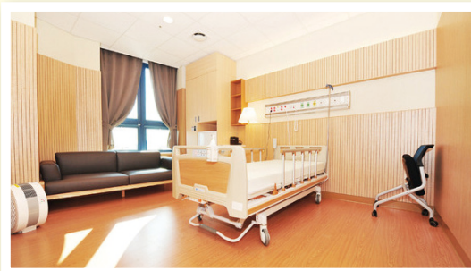
사진출처 _ 국립암센터 내 임종실

수급자가 좋아하는 사진, 책, 장식품 등을 배치하여 정서적 안정감을 줄 수 있도록 함