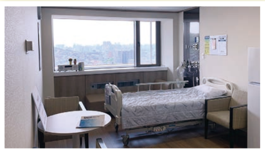
사진출처 _ 서울대학교병원 내 임종실